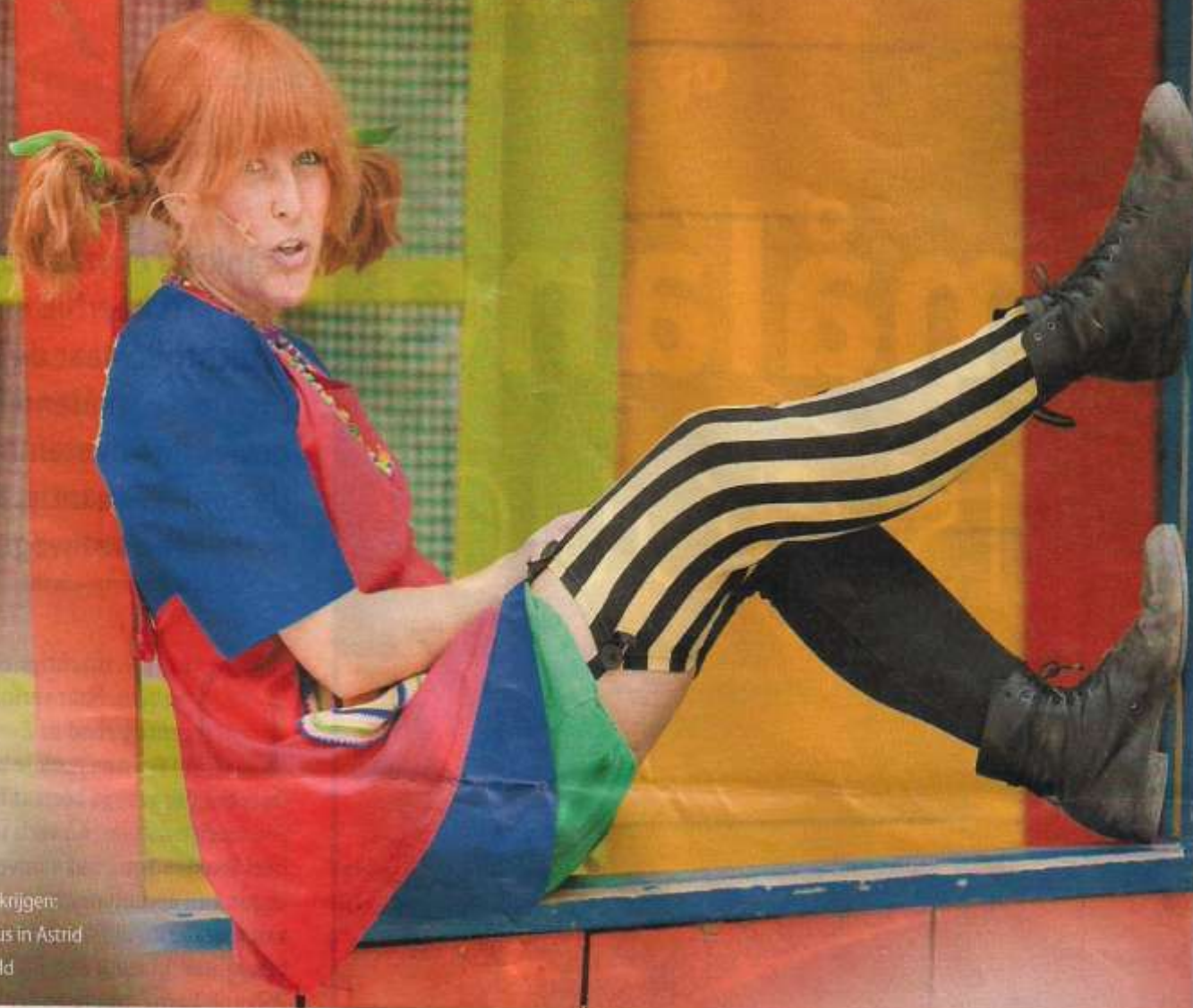
Niet kapot te krijgen: Pippi Langkous in Astrid Lindgrens Varld

Maar onder de oppervlakte borrelt het. Want bij Vimmerby ligt óók Zwedens populairste pretpark. Astrid Lindgrens Varld is een topattractie voor Zweedse kinderen (die kennen de verhalen van de Zweedse schrijfster uit het hoofd), maar ook Nederlandse kinderen kunnen zich helemaal verliezen in het prachtig aangelegde park. Hier geen mega-attracties, geen Disney-commerce. De nadruk ligt op lekker bewegen en genieten van de toneelstukjes die acteurs de hele dag door opvoeren. Pippi Langkous speelt en zingt, Karlsson van het dak propellert in het rond en uiteraard is ook Emil van de partij. De voertaal is Zweeds, maar Nederlandse kinderen hebben het hier veel te druk om zich over zo'n futilliteit druk te maken.